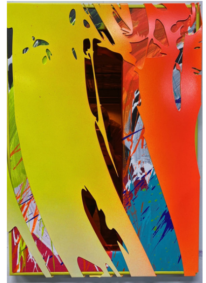
Marton Nemes, Meta painting 20, 70 x 50 x 4 cm, 2022