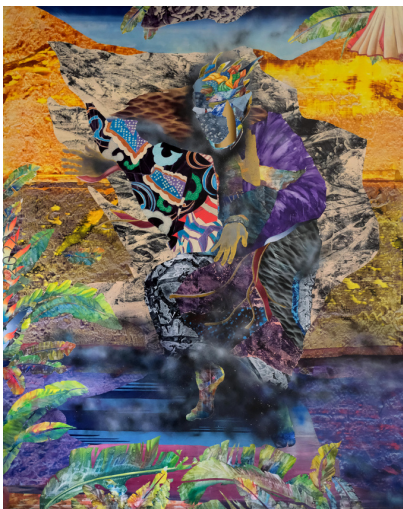
Jade Fenu, Dancing Chamane, acrylic on linen, 250x200cm

Exposition inaugurale de l'espace, Slumberland de l'artiste plasticien Jade Fenu fleurira les murs du second espace de la 193 Gallery. Peinture-poème, ses œuvres oniriques abordent la matière en quête d'une constante recherche d'équilibre, oscillant entre la force et la fragilité. Récit universel alliant l'abstrait et le figuratif : cette série donne à voir le foisonnement du réel et de l'imaginaire tout en interrogeant les enjeux actuels de notre société.