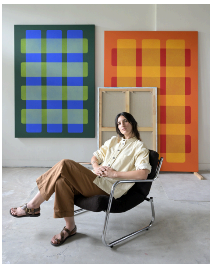
Portrait de Valentina Canseco

Un reflet derrière une Chimère invite les visiteurs à sonder l'espace en mutations, à travers une vision ronde et heurtée, poésie éthérée de la monstruosité. L'univers de Valentina Canseco est caractérisé par la décomposition de l'idée de puissance dans la couleur. Cette exposition se présente donc comme une nouvelle étape dans la création de l'artiste; la continuité d'une recherche minimaliste qui donne décidément la priorité aux sens.